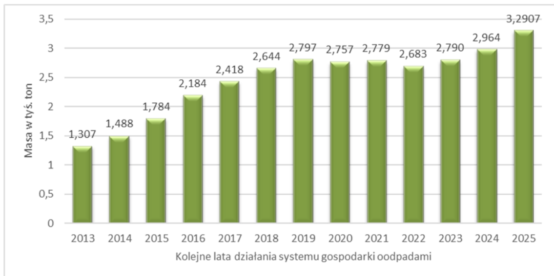
Rysunek 2. Masa wytworzonych odpadów w gminie Sanok w latach 2013 – 2025.

W roku 2025 odebrano od mieszkańców Gminy Sanok 2982,26 Mg odpadów komunalnych oraz 308,39 Mg odpadów budowlanych, co łącznie daje 3290,65 Mg. (Dla porównania w poprzednich latach zebrano: w 2024 -2964,93 Mg; 2023 - 2790,202 Mg; 2022 - 2683,11 Mg; w 2021 – 2779,581 Mg; w 2020 – 2756,887 Mg; w 2019 – 2796,572 Mg; 2018 – 2643,92 Mg; 2017 – 2418,091 Mg; w 2016 – 2184,233 Mg; w 2015 – 1783,5 Mg; w 2014 – 1487,9 Mg; w 2013 – 1306,96 Mg.) Przyjmując, że na terenie Gminy Sanok wytwarza odpady 14391 mieszkańców (zgodnie z deklaracjami), nagromadzenie odpadów na mieszkańca za rok 2025 wynosiło 229 kg.