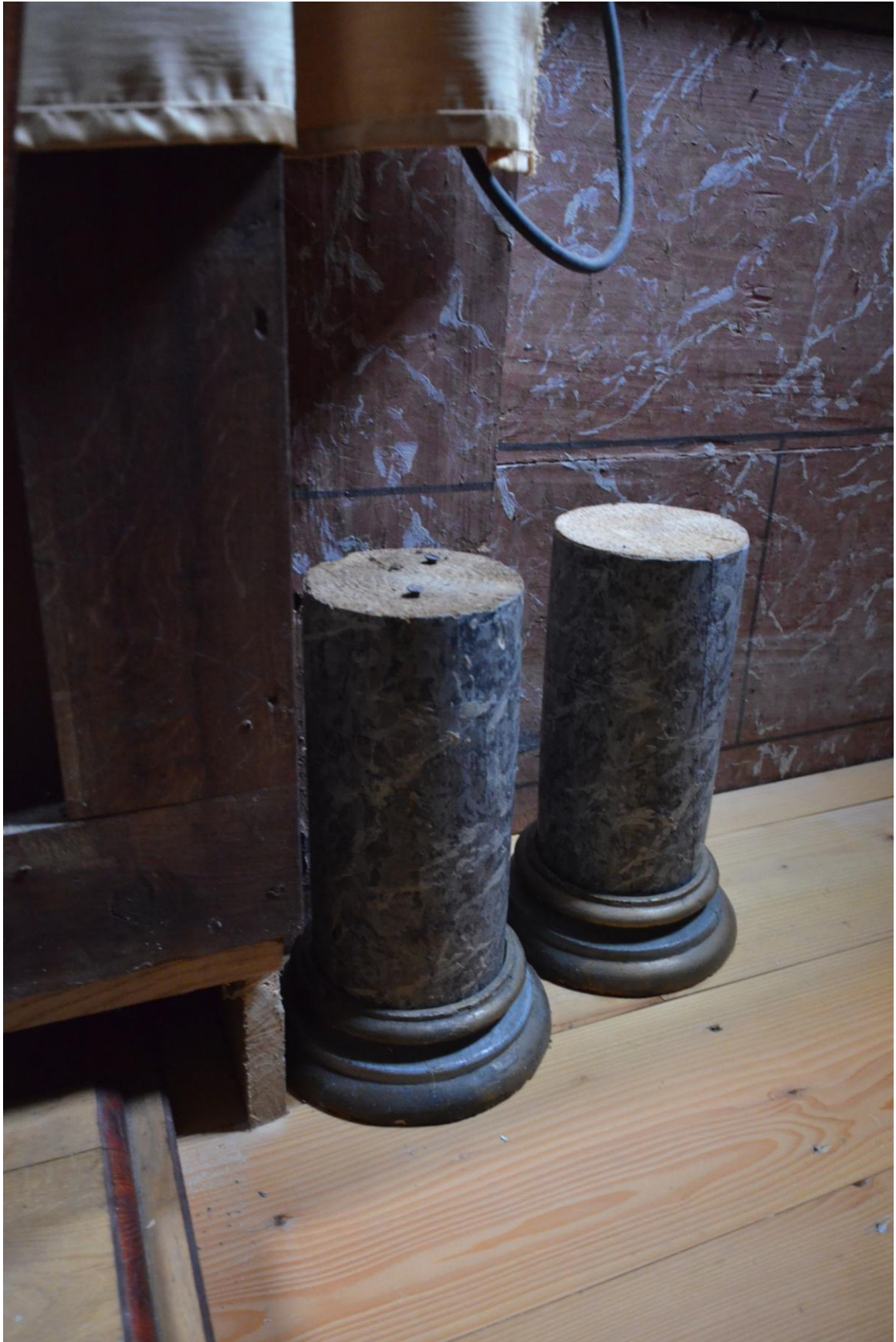
Fot. 14. Kostarowce, kościół pw. Narodzenia NMP, prezbiterium, ikonostas (fragm.). Stan przed konserwacją. Za ikonostasem przechowywane są fragmenty kolumn skróconych w trakcie prac przy modyfikacji prestołu. Fot. A. Opalińska