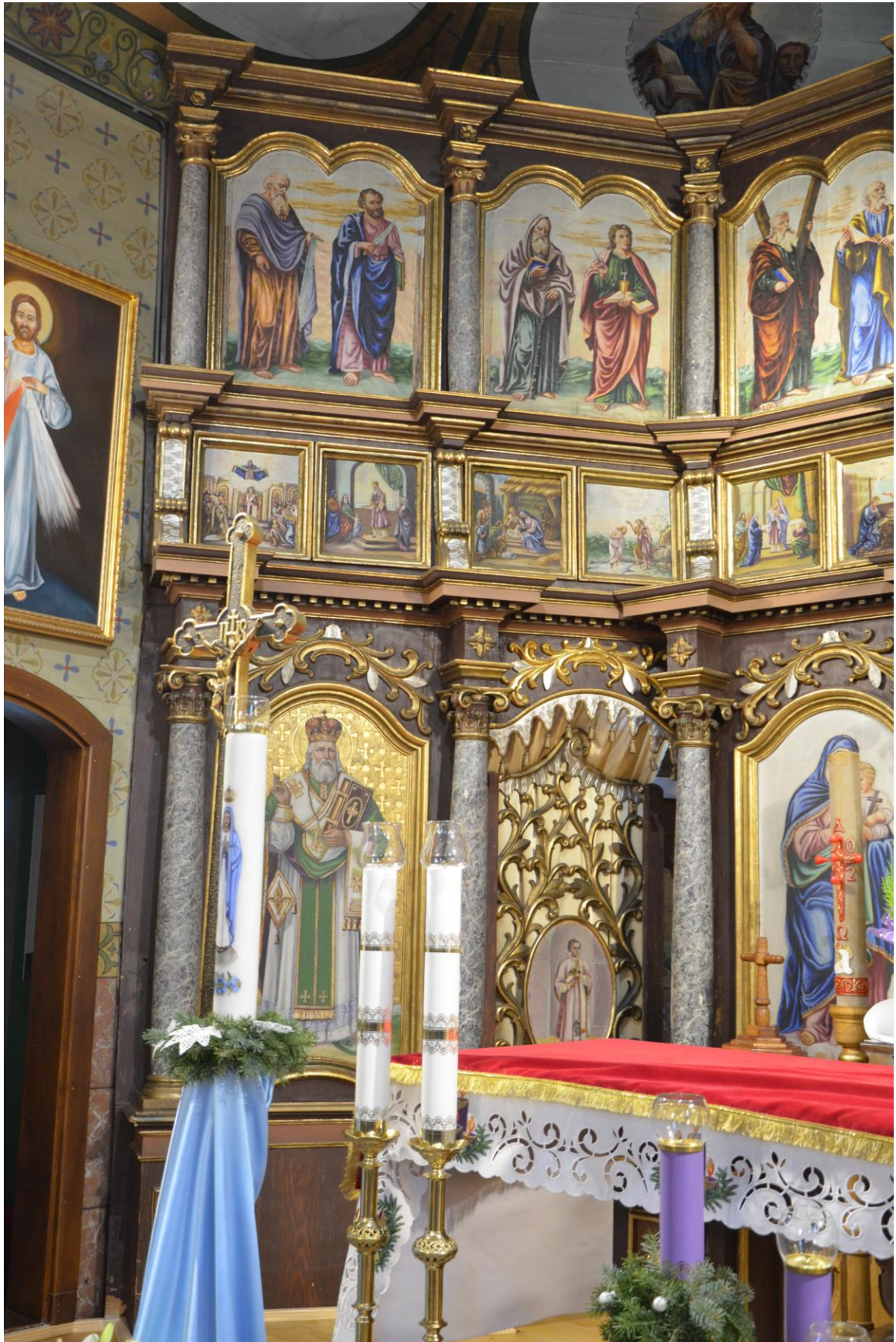
Fot. 8. Kostarowce, kościół pw. Narodzenia NMP, prezbiterium, ikonostas, XIX w. widok ogólny (fragm.). Stan przed konserwacją.