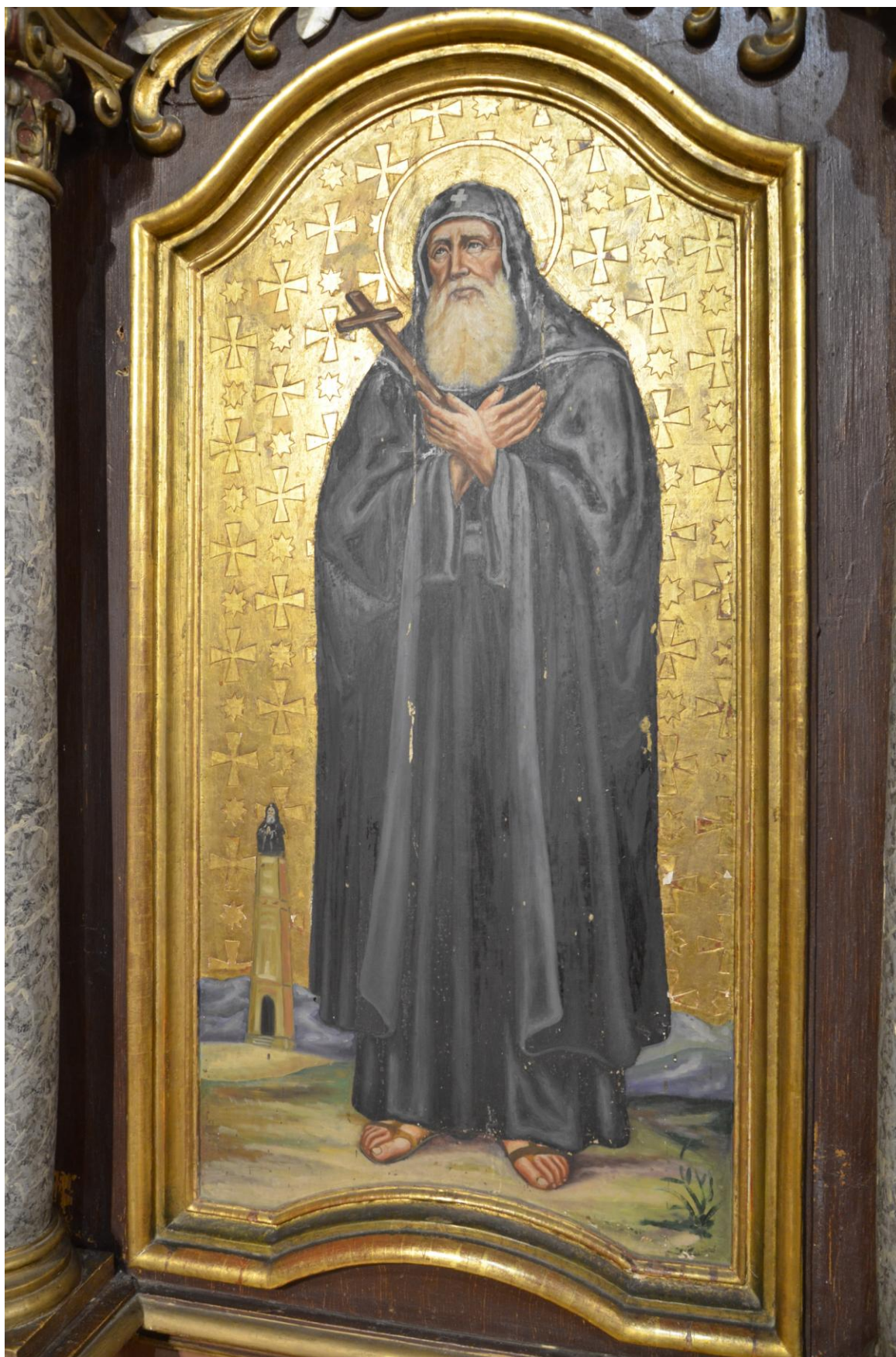
Fot. 13. Kostarowce, kościół pw. Narodzenia NMP, prezbiterium, ikonostas, XIX w., ikona z przedstawieniem Św. Szymona Słupnika, widok ogólny (fragm.). Stan przed konserwacją. Widoczne drobne wykruszenia warstwy malarskiej.