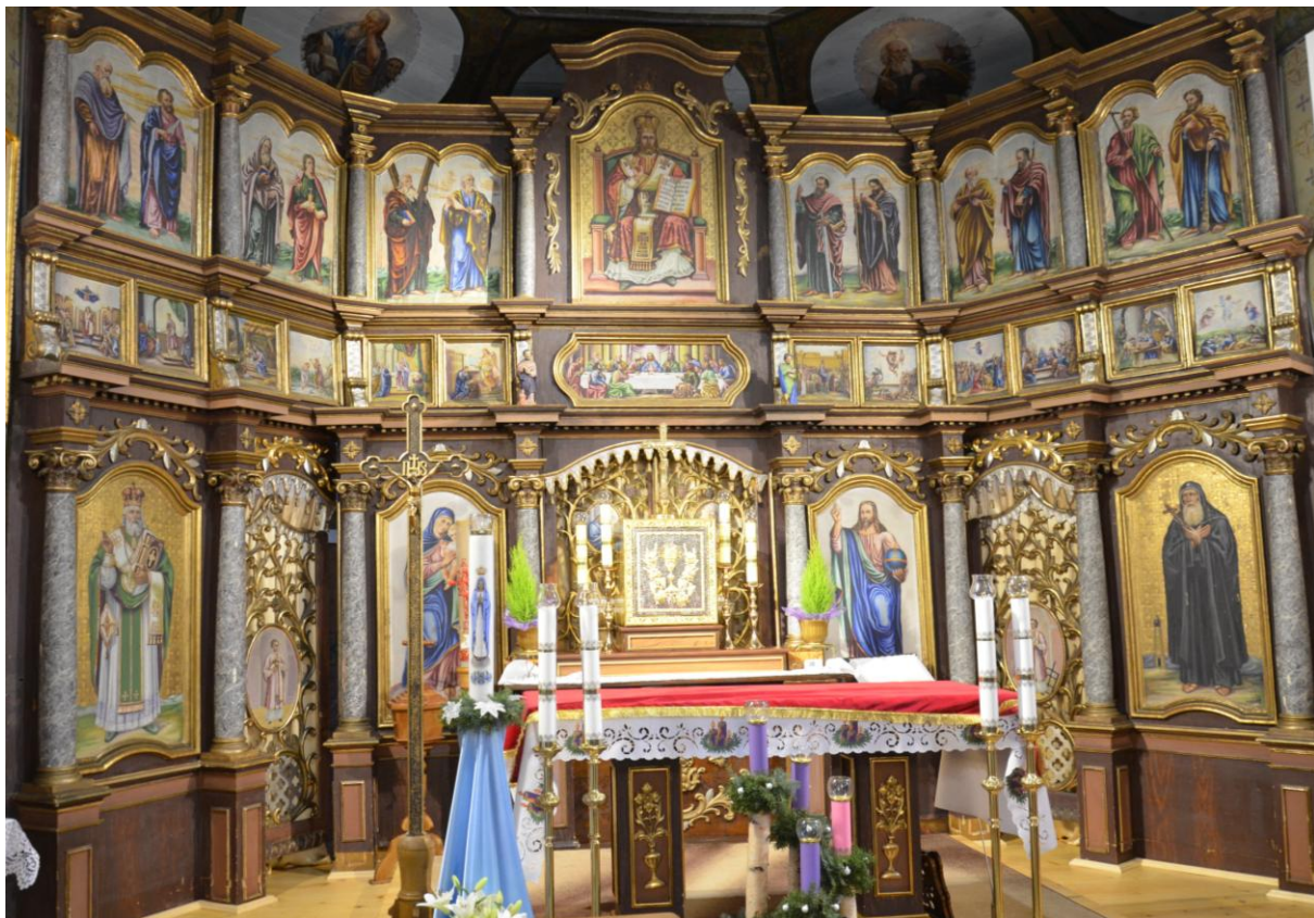
Fot. 1. Kostarowce, kościół pw. Narodzenia NMP, prezbiterium, ściana wschodnia, ikonostas