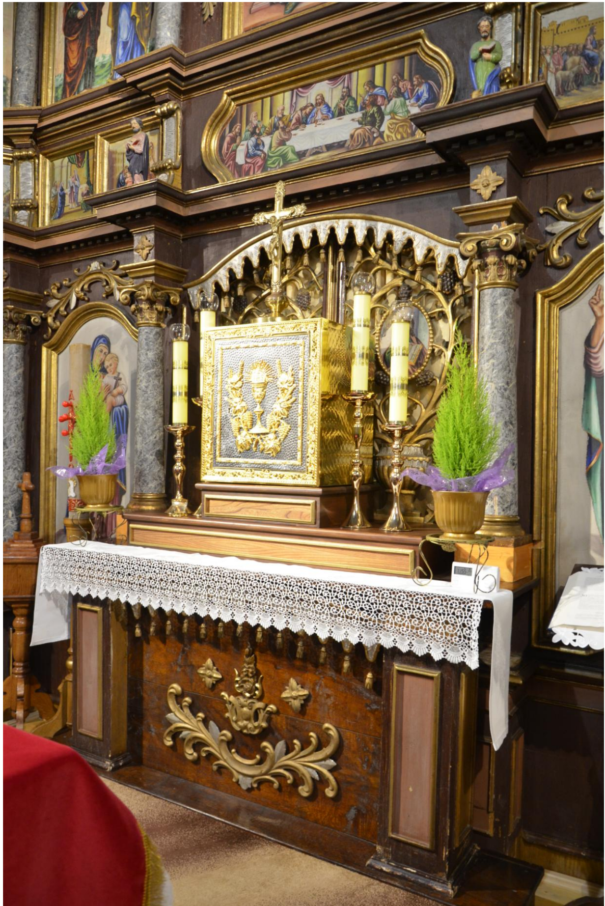
Fot. 7. Kostarowce, kościół pw. Narodzenia NMP, prezbiterium, ikonostas, XIX w. widok ogólny (fragm.). Stan przed konserwacją.