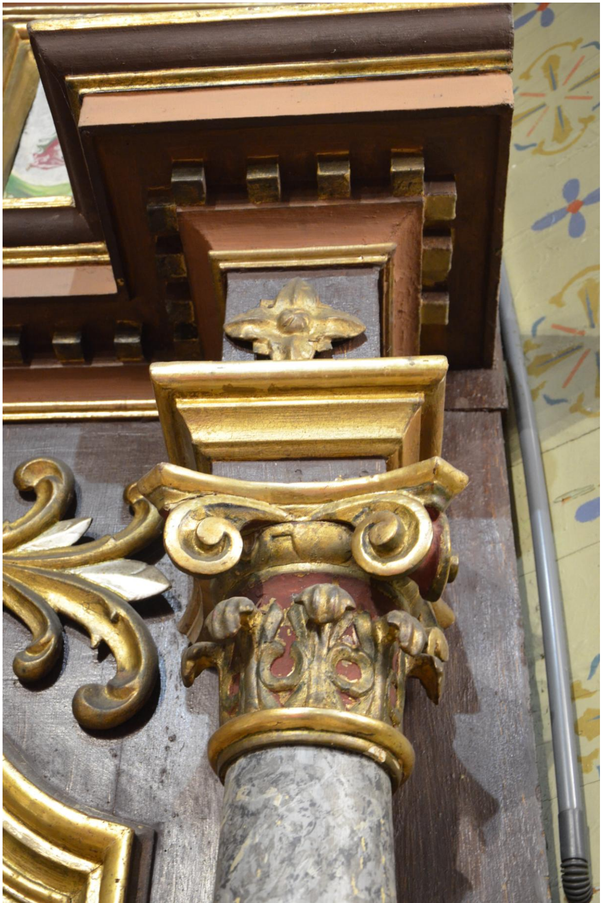
Fot. 11. Kostarowce, kościół pw. Narodzenia NMP, prezbiterium, ikonostas (fragm.), XIX w. Stan przed konserwacją. Widoczne znaczne zabrudzenie powierzchni.