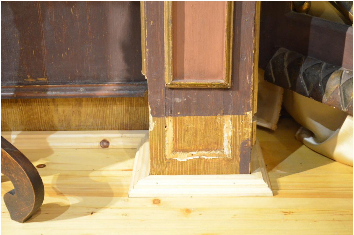
Fot. 10. Kostarowce, kościół pw. Narodzenia NMP, prezbiterium, ikonostas, XIX w. widok ogólny (fragm.). Stan przed konserwacją. Pod warstwą brązowego przemalowania widoczna jest starsza, jaśniejsza warstwa fladru i ubytek po profilu płyciny.