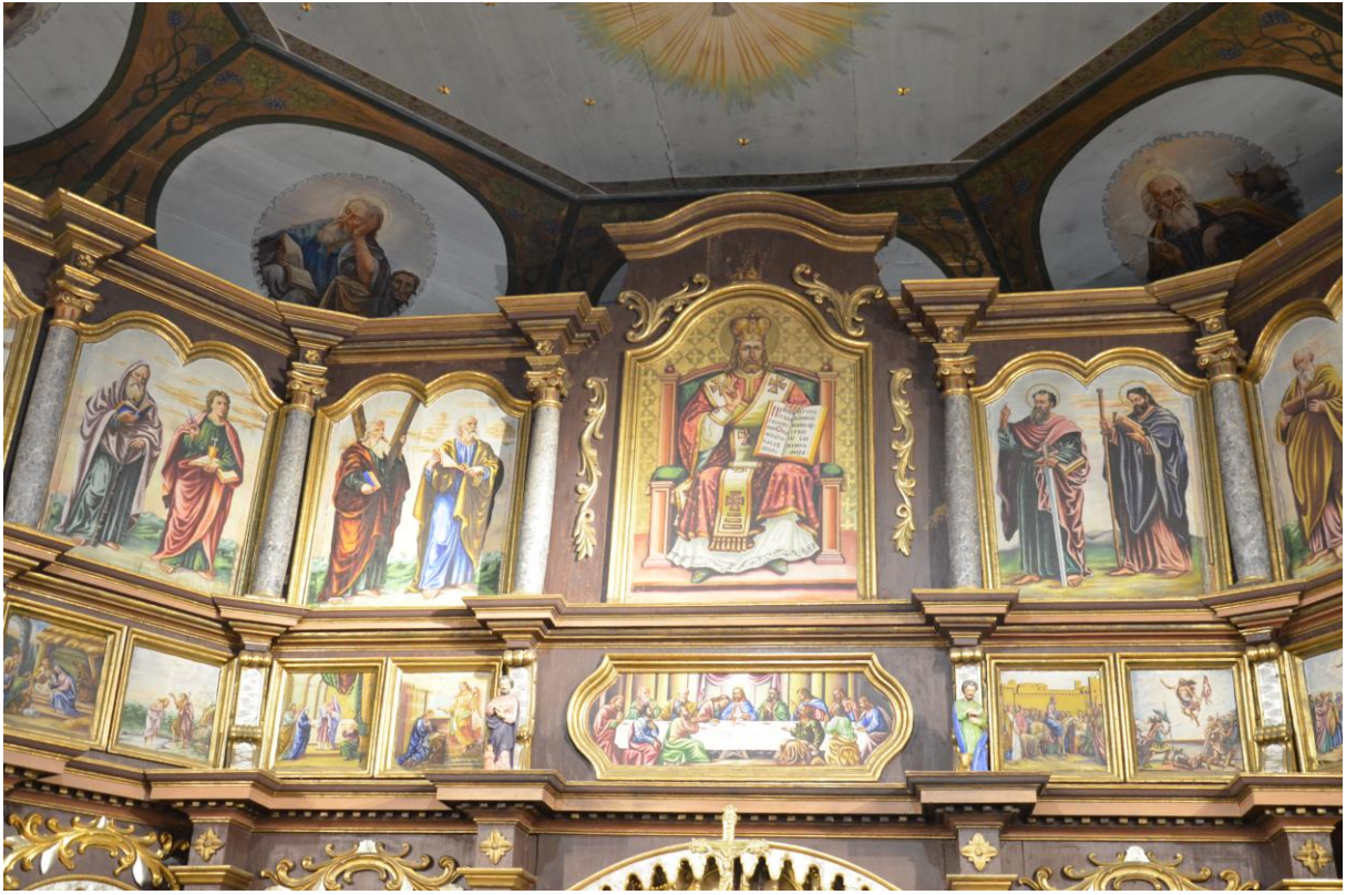
Fot. 6. Kostarowce, kościół pw. Narodzenia NMP, prezbiterium, ikonostas, XIX w. widok ogólny (fragm.). Stan przed konserwacją.