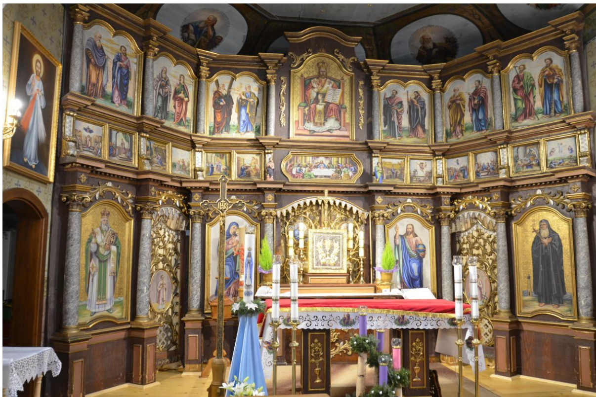
Fot. 5. Kostarowce, kościół pw. Narodzenia NMP, prezbiterium, ikonostas, XIX w. widok ogólny. Stan przed konserwacją.