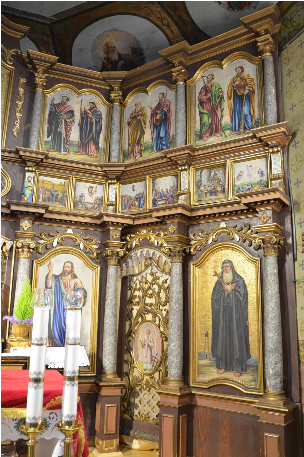
Fot. 9. Kostarowce, kościół pw. Narodzenia NMP, prezbiterium, ikonostas, XIX w. widok ogólny (fragm.). Stan przed konserwacją.