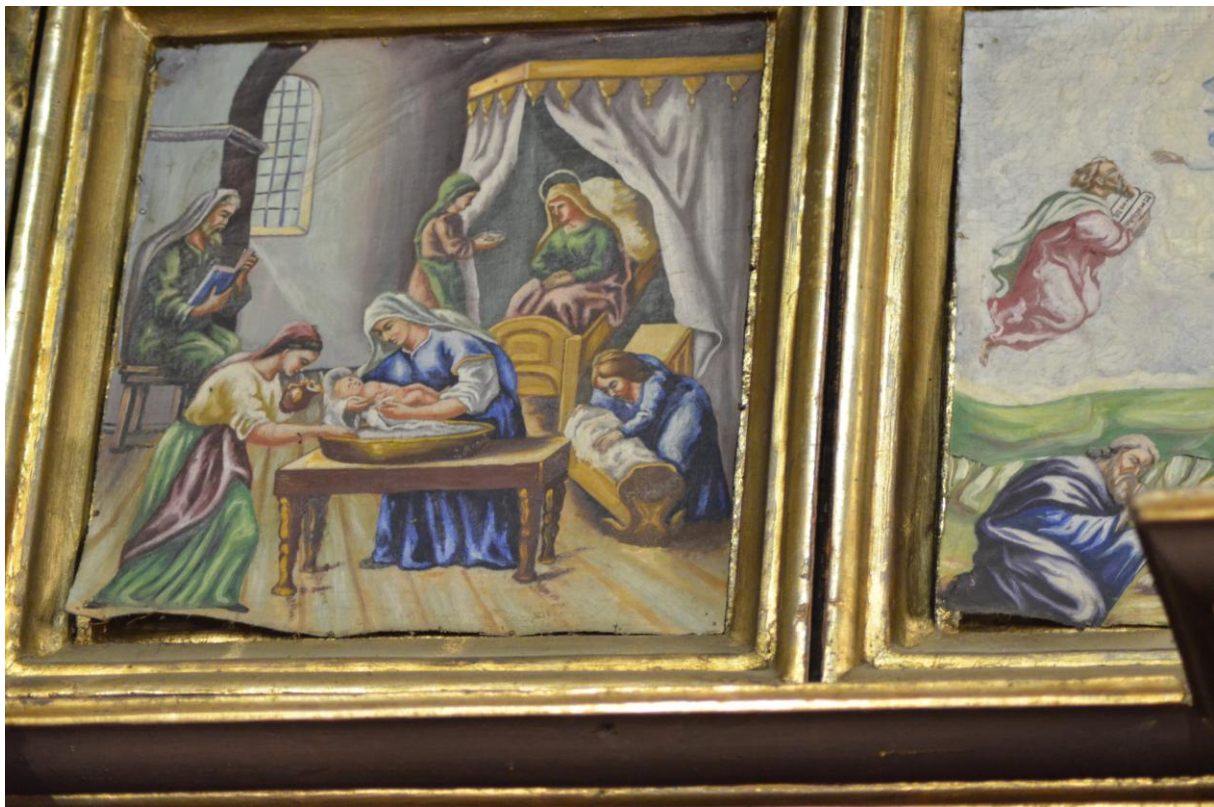
Fot. 12. Kostarowce, kościół pw. Narodzenia NMP, prezbiterium, ikonostas (fragm.), rząd prazdników, ikony, 1939 r. Stan przed konserwacją. Widoczne znaczne odspojenia płociennego podobrazia.