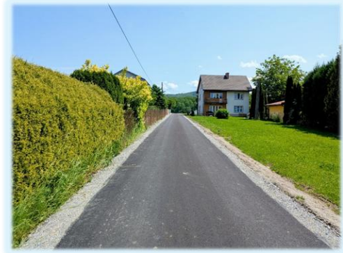
fot. Trepczą, ul. Wiśniowa

Przebudowa drogi gminnej k. Cmentarza w miejscowości Kostarowce.