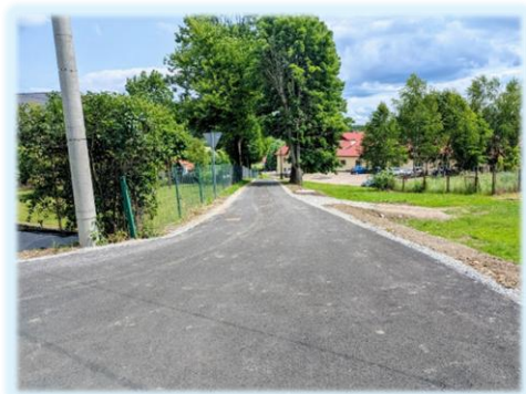
Fot. Srogów Górny

Zakres wykonanych prac obejmował: poszerzenie istniejącego placu postojowego, wykonanie odwodnienia liniowego , montaż betonowych obrzeży , ułożenie nowej nawierzchni asfaltowej o łącznej powierzchni 390 m 2 . Wartość zrealizowanych robót wyniosła 63 500 zł