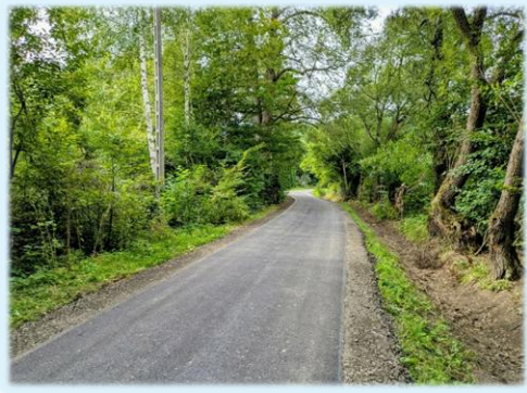
fot. Tyrawa Solna