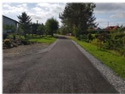
Fot. Pisarowce – droga gminna „na Kalawe” dz. nr ew. 932/19

W ramach umowy na asfaltowanie wykonano 109 m nowej nawierzchni asfaltobetonowej drogi „na Kalawe” na dz. nr ew. 932/19 w miejscowości Pisarowce, której łączny koszt wyniósł 43 234,64 zł.