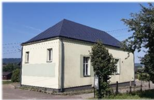
Wiejski Dom Kultury w Jędruszkowcach.

Utwardzenie terenu przy Wiejskim Domu Kultury-19999,8 zł.