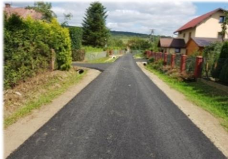
Fot. Pisarowce – droga gminna nr 117357R Pisarowce – Dudyńce