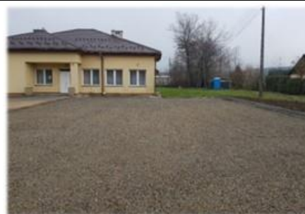
Fot. Sanoczek – plac postojowy obok WDK

Wykonanie placu postojowego obok WDK położonego na dz. nr ew. 248/1 w miejscowości Sanoczek o powierzchni 250 m 2 nawierzchni z kruszywa łamanego. Roboty wykonano w całości ze środków przekazanych przez Budimex S.A. w ramach podpisanego porozumienia w kwocie 33 065,78 zł.