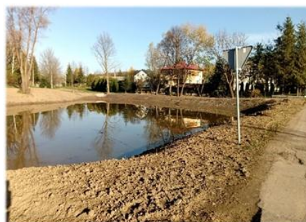
Fot. Zbiornik w Markowcach po renowacji