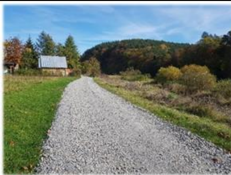
Fot. Mrzygłód – przebudowa drogi do gruntów rolnych na dz. nr ew. 1282, 1162, 859

Remont drogi dojazdowej do gruntów rolnych w miejscowości Mrzygłód. W ramach umowy przebudowano drogę położoną na dz. nr ew. 1282, 1162 oraz 859 wykonując na długości 330 mb nawierzchnię z tłucznia niesortowanego oraz 125 m drogi gruntowej. Łączny koszt robót to 65 480,37 zł z czego 55 000,00 zł stanowi dofinansowanie Samorządu Województwa Podkarpackiego.