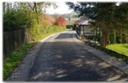
Fot. Dębna - droga wewnętrzna gminna „ w kier. Szkoły” na dz. nr ew. 87

Asfaltowanie drogi gminnej „w kier. Szkoły” położonej na dz. nr ew. 87 w m. Dębna o długości 75 mb. Koszt inwestycji to 20 689,66 zł. W ramach odrębnej umowy wykonany mur oporowy w celu poszerzenia nawierzchni asfaltowanej drogi. Wartość robót wyniosła 15 012,84 zł.