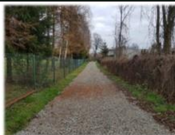
Fot. Zabłotce – droga gminna na dz. nr ew. 401/8

Wykonanie drogi gminnej o nawierzchni z kruszywa łamanego „k. hurtowni Turam” w miejscowości Zabłotce. Długość odcinka 135m, koszt wykonywanych robót 11 970,00 zł.