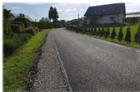
Fot. Kostarowce – droga wewnętrzna gminna położona na działkach gminnych do budynku nr 234

Wyremontowano i wzmocniono istniejącą nawierzchnię bitumiczną na drodze wew. gminnej „k. cmentarza” na dz. nr ew. 605 w m. Kostarowce, odcinek o długości 20 m, koszt 7 256,39 zł. W ramach umowy na asfaltowanie wykonano 260m nowej nawierzchni asfalto – betonowej na drodze gminnej do budynku nr 234 w m. Kostarowce, której całkowity koszt wyniósł 117 817,75 zł.