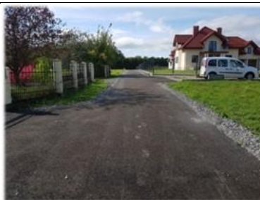
Fot. Zabłotce – droga gminna osiedle „Tuchorz”

Asfaltowanie drogi gminnej położonej na dz. nr ew. 401/8 o długości 99m w miejscowości Zabłotce, Osiedle „Tuchorz”. Koszt robót 46 986,89 zł.