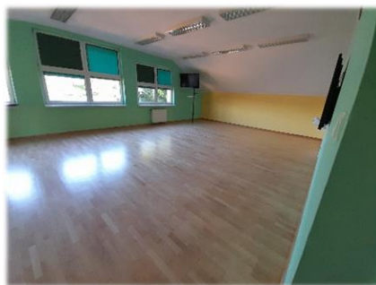
Szkoła Podstawowa w Falejówce.

Remont podłogi w szkole w Falejówce- 9169,65 zł.