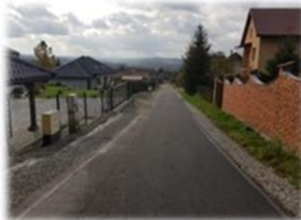
Fot. Bykowce - droga wewnętrzna gminna „ul. Jasna” dz. nr ew. 110

W ramach umowy na asfaltowanie wykonano 260 m nowej nawierzchni asfalto-betonowej na ul. Jasnej w miejscowości Bykowce. Koszt inwestycji to 94,498,90 zł.