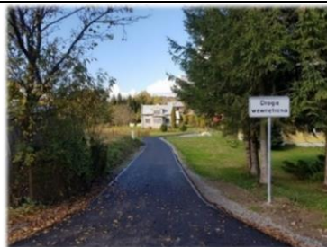
Fot. Strachocina - droga gminna do dz. nr ew. 168