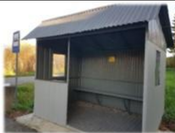
Fot. Stróże Małe - przystanek autobusowy

Remont dwóch przystanków autobusowych w miejscowości Stróże Małe, których koszt wyniósł 4 500,00 zł.