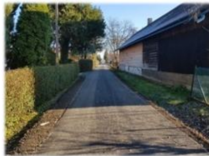
Fot. Jurowce – Kostarowce droga położona na dz. nr ew. 209, 211, 215 w m. Jurowce oraz 852, 713, 693 w m. Kostarowce