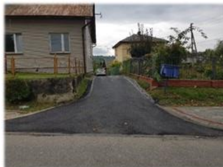
Fot. Niebieszczany – nakładka asfaltobetonowa k. dawnego Ośrodka Zdrowia

Wykonanie nakładek asfaltobetonowych w miejscowości Niebieszczany w ciągu dróg wewnętrznych gminnych „k. Dworu”, odcinek o długości 75 m oraz „k. Dawnego Ośrodka Zdrowia”, odcinek długości 36 m, łączna wartość robót wyniosła 31 713,34 zł