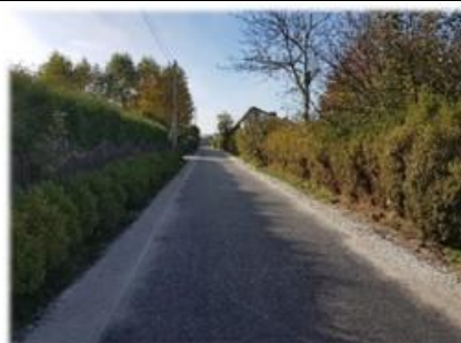
Fot. Trepcza – ul. Jasna

Remont drogi gminnej przy ul. Jasnej w miejscowości Trepcza, polegający na wykonaniu podbudowy z kłińca na odcinku 92 m i nawierzchni z betonu asfaltowego na całości drogi o długości 405 m. Całkowity koszt robót wyniósł 132 616,24 zł.