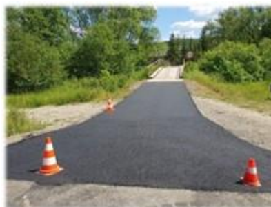
Fot. Tyrawa Solna – zjazd z drogi powiatowej na drogę gminną

Wykonanie zjazdów z masy asfaltobetonowej w ciągu drogi powiatowej nr 2220R Mrzygłód – Tyrawa Solna na drogi gminne w związku z przebudową w/w drogi powiatowej. Umowna wartość robót to 15 173,17 zł.