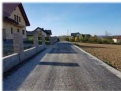
Fot. Trepcza – asfaltowanie ulicy Widokowej

W ramach umowy na asfaltowanie wykonano nową nawierzchnię asfaltobetonową na drodze gminnej, ul. Widokowa na odcinku 120 m, której koszt wyniósł 51 120,35 zł.