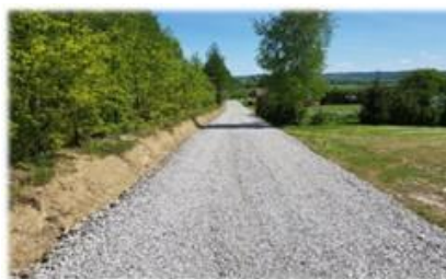
Fot. Markowce - Remont drogi gminnej na dz. nr ew. 125/16

Wykonanie poszerzenia jezdni oraz nawierzchni z kruszywa łamanego na długości 130 m, na dz. nr ew. 125/16 obręb Markowce, umowna wartość robót 22 168,29 zł.