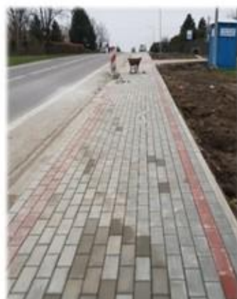
Fot. Czerteż- chodnik przy drodze krajowej nr 886 Domaradz – Sanok