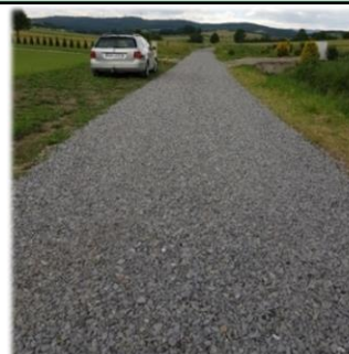
Fot. Jędruszkowce – droga wewnętrzna gminna na dz. nr ew. 176/1

Roboty drogowe w zakresie remontu drogi gminnej „w kier. budynku nr 53A oraz 80” na dz. nr ew. 176/1 w miejscowości Jędruszkowce. Wykonanie nawierzchni z kruszywa naturalnego oraz łamanego na odcinku 135 m. Umowna wartość robót 19 311,00 zł