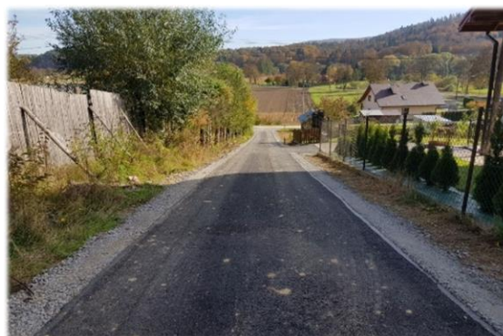
Fot. Mrzygłód – droga gminna „Pod las” dz. nr ew. 1118

Roboty drogowe w zakresie karczowania pni i krzaków, wykopu rowu odwaniającego na odcinku 60 m, oczyszczenie namułu z istniejącego rowu na odcinku 215mb, wykonaniu przepustu zjazdu oraz utwardzeniu poboczy w obrębie wydłużonego przepustu. Umowny koszt robót 16 993,13 zł. W ramach umowy na asfaltowanie wykonano 108 mb nowej nawierzchni asfalto-betonowej na drodze gminnej „Pod las” na dz. nr ew. 1118 w miejscowości Mrzygłód. Umowny koszt robót 38 547,79 zł.