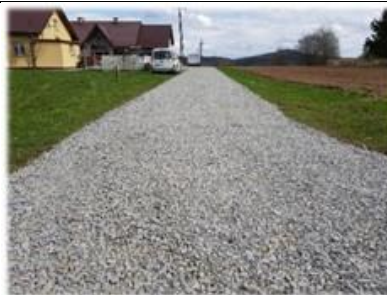
Fot. Łodzina – wykonanie nawierzchni z kruszywa łamanego na drodze gminnej

Prace polegające na wykonaniu nawierzchni z kruszywa łamanego na dz. nr ew. 671, 333/1 oraz 333/4 w miejscowości Łodzina, wartość robót wyniosła 4 390,13 zł.