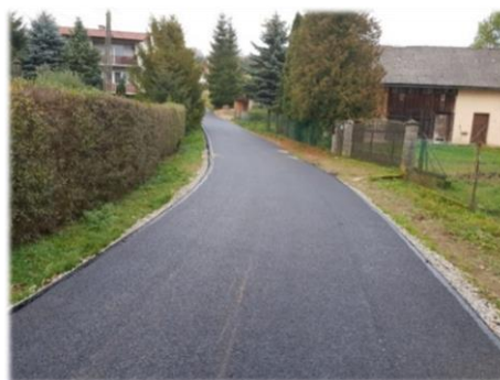
Fot. Prusiek – droga gminna nr 117431R

Roboty drogowe w ciągu drogi gminnej nr 117431Rw miejscowości Prusiek polegające na karczowaniu zakrzaczeń, demontażu płyt betonowych, przebudowie przepustów, wykonanie rowu otwartego, oczyszczeniu istniejącego rowu z namułu oraz wykonaniu podbudowy z kruszywa łamanego, długość drogi to 150mb, koszt wymienionych robót wyniósł 48 684,51 zł. W kolejnym etapie została wykonana nawierzchnia z betonu asfaltowego na w/w podbudowie, której koszt wyniósł 64 459,75 zł.