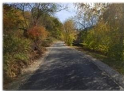
Fot. Dobra – droga wewnętrzna gminna na dz. nr ew. 654

Remont drogi gminnej w ramach umowy na asfaltowanie „Przysiółek Siemowice” na dz. nr ew. 654 w m. Dobra, odcinek drogi o długości 90 m, koszt robót wyniósł 45 247,43 zł.