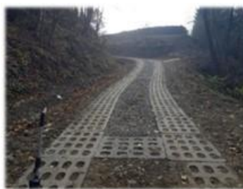
Fot. Wujskie – droga z płyt ażurowych przy drodze gminnej dz. nr ew. 52/1

Przebudowa drogi gminnej na dz. nr ew. 52/1 w miejscowości Wujskie polegająca na przygotowaniu podbudowy i wykonaniu nawierzchni z płyt ażurowych zbrojonych, wartość prac to 33 855,75 zł