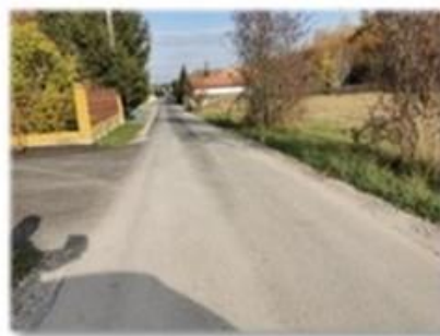
Fot. Czerteż – droga wewnętrzna gminna na dz. nr ew. 301/6

W ramach umowy na asfaltowanie wykonano nawierzchnię asfalto-betonową na dz. nr ew. 301/6, w m. Czerteż, nowa nawierzchnia na odcinku 180 m. Koszt wykonanych robót to 72 730,40 zł.