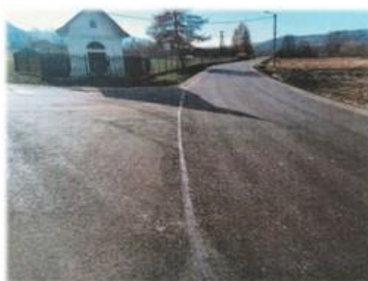
Fot. Dobra – droga powiatowa nr 2235R – Sanok – Dobra w miejscowości Dobra

W ramach podpisanej umowy w sprawie udzielenia pomocy finansowej dla Powiatu Sanockiego, Gmina Sanok przekazała 150 000,00 zł z przeznaczeniem na dofinansowanie realizacji zadania pn. „Przebudowa drogi powiatowej nr 2235R Sanok – Dobra w km od 17+920 do 18+170 w m. Dobra”.