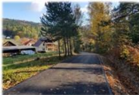
Fot. Liszna - droga wewnętrzna gminna „ w kier. Sporkowej” dz. nr ew. 168/1

Przebudowa drogi gminnej w ramach umowy na asfaltowanie „ w kier. Sporkowej” o długości 130 m, położonej na dz. nr ew. 168/1 w miejscowości Liszna, umowna wartość robót 67 723,00 zł.