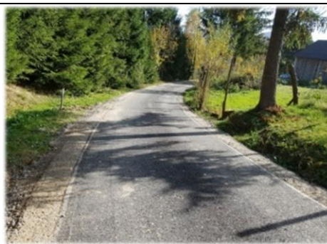
Fot. Hłomcza – Droga wewnętrzna gminna na dz. nr ew. 774

W ramach umowy na asfaltowanie wykonano 85 m nowej nawierzchni asfalto-betonowej drogi gminnej położonej na dz. nr ew. 774 w m. Hłomcza. Koszt robót wyniósł 30 992,38 zł.