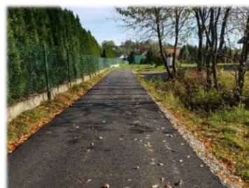
Fot. Trepcza – ul. Wesoła w kier bud.7 i 7a