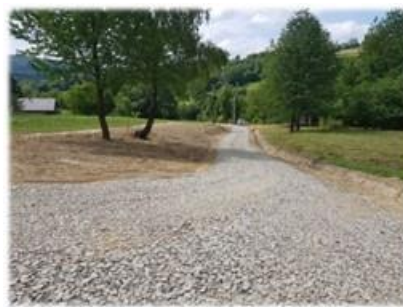
Fot. Raczkowa – droga gminna do budynków nr 86 oraz 88

Roboty drogowe w zakresie remontu drogi gminnej do budynków nr 86 oraz 88 w miejscowości Raczkowa na długości 325 m, polegające na karczowaniu pni, robotach ziemnych, wykonaniu przepustów pod koroną drogi oraz zjazdami, nowych warstw konstrukcji podbudowy i nawierzchni z kruszywa łamanego. Koszt robót to 59 737,03 zł.