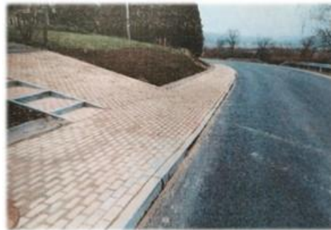
Fot. Załuż – chodnik przy drodze powiatowej nr 2227R

Gmina Sanok udzieliła pomocy finansowej Powiatowi Sanockiemu na budowę bezpiecznych przejść dla pieszych wraz z chodnikami przy drogach powiatowych w miejscowościach Prusiek, Strachocina oraz Srogów Dolny. W sumie na w/w cel przeznaczono 156 000,00 zł.