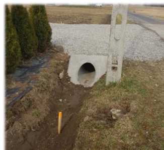
Fot. Kostarowce - przebudowa nawierzchni drogi na dz. nr ew. 684, Fot. Kostarowce - Przebudowa zjazdu drogi na dz. nr ew. 68