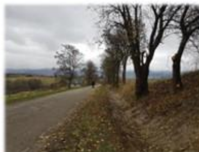
Fot. Stróże Wielkie - droga gminna, dz. nr ew. 850/2

Odmulenie rowów, wycinka i utylizacja zakrzaczeń w miejscowości Stróże Wielkie przy drodze położonej na dz. nr ew. 850/2. Wartość wykonanych robót wyniosła 14 76,15 zł