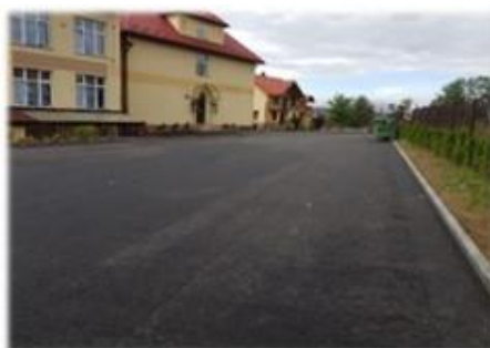
Fot. Niebieszczany – Plac postojowy obok Szkoły

Asfaltowanie drogi gminnej w miejscowości Pakoszówka.