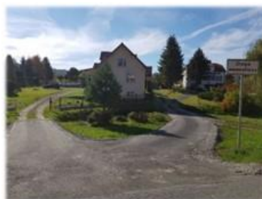
Fot. Strachocina – droga gminna do budynku nr 196 Fot. Strachocina - droga gminna do budynku nr 197 oraz 200