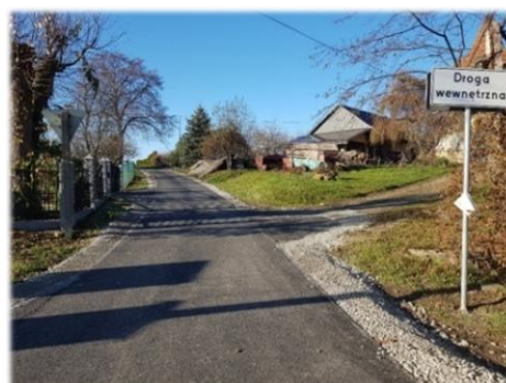
Fot. Sanoczek – droga do pasa montażowego gazociągu DN1000 Strachocina – Granica RP

Remont – wzmocnienie drogi gminnej nr 117354R o nawierzchni bitumicznej w miejscowości Sanoczek wykorzystywanej jako dojazd do pasa montażowego gazociągu DN1000 Strachocina – Granica RP położonej na dz. nr ew. 397, 394, 340, 112. Długość całego remontowanego odcinka wynosi 138 m. Roboty wykonano w całości ze środków przekazanych przez Budimex S.A. w ramach podpisanego porozumienia w kwocie 138 823,90 zł