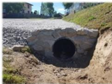
Fot. Łodzina – rów kryty przy drodze gminnej nr ew. 666

Roboty drogowe w zakresie remontu drogi gminnej „przez wieś” w kier. cmentarza obręb Łodzina, polegające na oczyszczeniu rowu z namułu, wykonanie rowu krytego oraz ubezpieczeniu wylotu kamieniem technicznym. Wykonanie nawierzchni odcinka jezdni z kruszywa łamanego, całkowity koszt zadania wyniósł 15 001,50 zł.