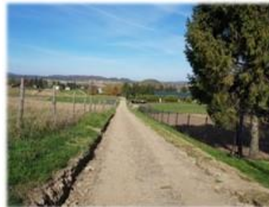
Fot. Jurowce – drogi położone na dz. nr ew. 225 oraz 194

Remont nawierzchni drogi w miejscowościach Jurowce oraz Kostarowce.