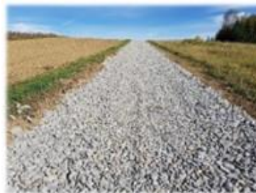
Fot. Strachocina - droga dojazdowa do gruntów rolnych, dz. nr ew. 1583, 1878 Fot. Strachocina - droga dojazdowa do gruntów rolnych, dz. nr ew. 1598