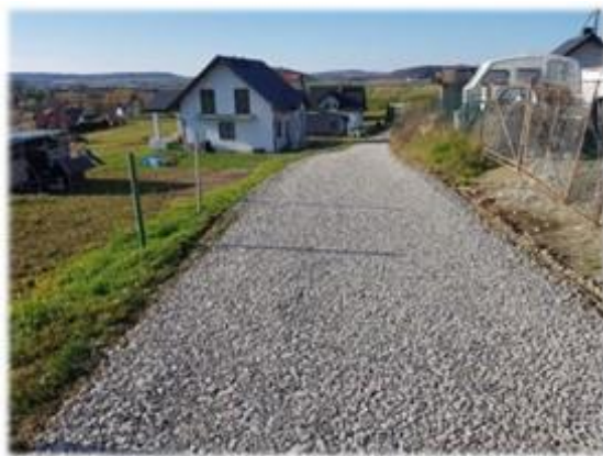
Fot. Srogów Górny – droga gminna na dz. nr ew. 1273/1

Roboty drogowe w zakresie remontu dróg dojazdowych do pól w miejscowości Srogów Dolny, obejmowały: wykopy oraz przekopy w gruncie, wykonanie rowu odwadniającego, oczyszczenie istniejącego rowu z namułu, remont przepustu rurowego, wykonanie nawierzchni z kruszywa łamanego, całość robót wyniosła 16 944,14 zł. Remont drogi gminnej położonej na dz. nr ew. 1273/1 w miejscowości Srogów Górny, przygotowanie podbudowy i wykonanie warstwy jezdnej z kłińca sortowanego na długości 190 m, którego koszt wyniósł 26 662,24 zł.