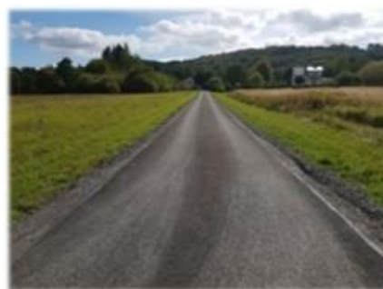
Fot. Sanoczek - droga wewnętrzna gminna „os. Tuchorz” dz. nr ew. 470, 23/12

W ramach umowy na asfaltowanie wykonano 150 m nowej nawierzchni asfalto-betonowej drogi gminnej położonej na dz. nr ew. 470, 23/12, osiedle Tuchorz w miejscowości Sanoczek, koszt inwestycji 55 534,76 zł.