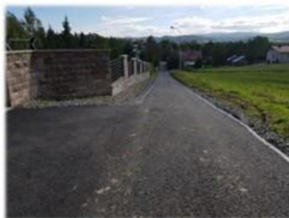
Fot. Markowce - droga wewnętrzna gminna na dz. nr ew. 250/18 i 229/52.

Asfaltowanie drogi gminnej położonej na dz. nr ew. 250/18, 229/52 o długości 80m, koszt wykonanych robót wyniósł 68 516,74 zł.