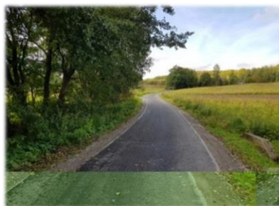
Fot. Strachocina – droga dojazdowa do pasa montażowego gazociągu DN1000

Remont/wzmocnienie drogi gminnej położonej na dz. nr ew. 860 w miejscowości Strachocina wykorzystywanej jako dojazd do pasa montażowego gazociągu DN1000 Strachocina – Granica RP. Długość remontowanego odcinka to 890 m. Roboty wykonano w całości ze środków przekazanych przez Budimex S.A. w ramach porozumienia w kwocie 159 169,07 zł.