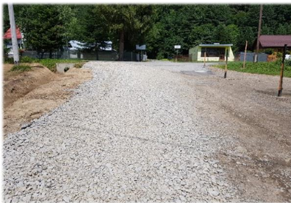
Fot. Międzybrodzie – droga „do spływu na Sanie”

Remont drogi gminnej położonej w miejscowości Międzybrodzie na dz. nr ew. 72 polegający na wykonaniu nawierzchni bitumicznej wraz z poboczami z kruszywa na całym odcinku remontowanej drogi o długości 63 m. Koszt inwestycji to 9 086,87 zł Roboty polegające na poszerzeniu korony drogi wewnętrznej gminnej na dz. nr ew. 149 oraz 148/68 „do spływu na Sanie” w miejscowości Międzybrodzie. Wykonano m.in. karczowanie krzaków, wykopano nowy rów oraz wykonano nawierzchnię na drodze z kruszywa łamanego. Wartość wszystkich robót wyniosła 18 574,25 zł.