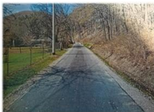
Fot. Międzybrodzie – droga wewnętrzna gminna na dz. nr ew. 58

Remont drogi gminnej na dz. nr ew. 58 w m. Międzybrodzie. Przedsięwzięcie polegające na wyrównaniu oraz wzmocnieniu istniejącej podbudowy z kruszywa łamanego oraz wykonaniu nawierzchni bitumicznej na długości 135 m. Całkowity koszt zadania wyniósł 51772,09 zł przy udziale środków Nadleśnictwa Brzozów w kwocie 25 000 zł.