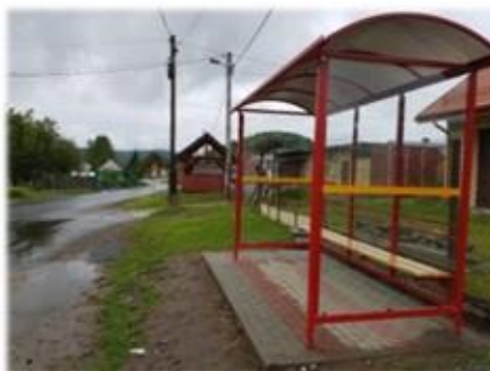
Fot. Tyrawa Solna – wiaty przystankowa przy WDK

Wykonanie peronu pod wiatę przystankową z kostki brukowej oraz zakup i montaż wiaty przystankowej, całość robót kosztowała 10 626,00 zł.