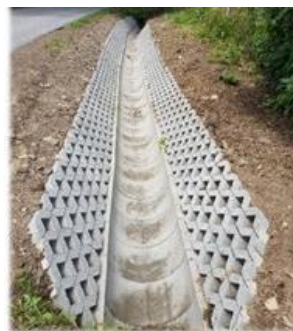
Fot. Trepcza – Wesoła

Roboty drogowe polegające na umocnieniu dna rowu oraz skarp rowu położonego przy drodze gminnej, ul. Wesoła w miejscowości Trepcza, dz. nr ew. 1062. Koszt wykonanych robót to 54 126,63 zł.