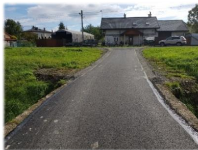
Fot. Strachocina - droga gminna do dz. nr ew. 292 oraz 362 Fot. Strachocina - droga do budynku nr 96