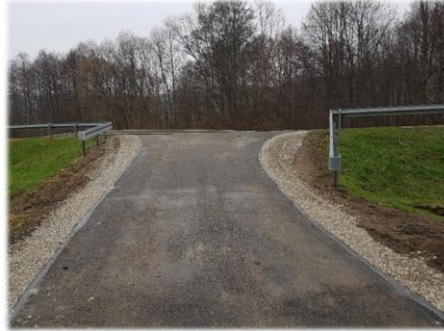
Fot. Załuż – zjazd z drogi krajowej na drogę gminną