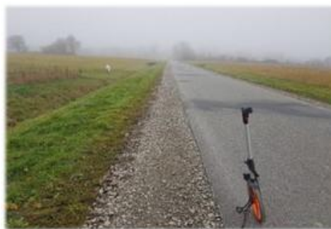
Fot. Kostarowce – Jurowce, droga do pasa montażowego gazociągu DN1000 Strachocina – Granica RP.

Remont poboczy na drodze gminnej nr 117355R Kostarowce – Jurowce na długości 1570 m, wykorzystywanej jako dojazd do pasa montażowego gazociągu DN1000 Strachocina – Granica RP, droga położona na dz. nr ew. 855 w m. Kostarowce oraz dz. nr ew. 218 w m. Jurowce. Inwestycja w całości wykonana ze środków przekazanych przez Budimex S.A. w ramach podpisanego porozumienia.