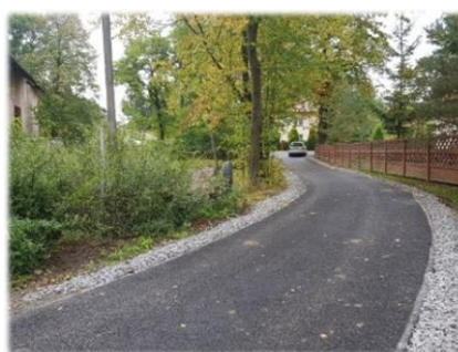
Fot. Niebieszczany – droga gminna na dz. nr ew. 629/1 Fot. Niebieszczany – droga gminna na dz. nr ew. 3727/3, 3708, 3829/