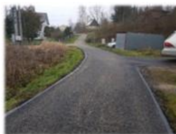
Fot. Stróże Małe – droga gminna „k. Transformatora”

Remont nawierzchni bitumicznej w ciągu drogi gminnej „k. Transformatora” położonej na dz. nr ew. 281/2 oraz 281/4 w miejscowości Stróże Małe. Długość remontowanego odcinka to 76m. Kosz robót wyniósł 18 497,23 zł.