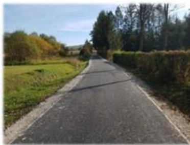
Fot. Tyrawa Solna – Droga wewnętrzna gminna dz. nr ew. 286

W ramach umowy na asfaltowanie wykonano 127 m nowej nawierzchni asfalto-betonowej na dz. nr ew. 286 w miejscowości Tyrawa Solna. Umowny koszt robót 49 687,93 zł