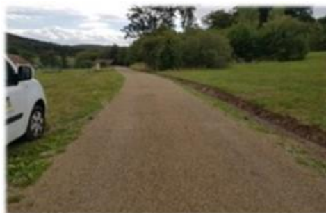
Fot. Droga wewnętrzna gminna „ w kier. Parku” w m. Falejówka

Roboty drogowe w zakresie modernizacji dróg gminnych („w kierunku Parku” oraz „na Przykopy”) na terenie m. Falejówka w ramach realizacji funduszu sołeckiego na łączną kwotę 51 668,50 zł.