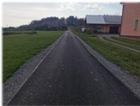
Fot. Pakoszówka – droga wewnętrzna gminna na dz. nr ew. 1294/2, 1295/12

Asfaltowanie drogi wewnętrznej gminnej w miejscowości Pakoszówka położonej na dz. nr ew. 1294/2 oraz 1295/12 o długości 168 m, której koszt wyniósł 61 880,27 zł.