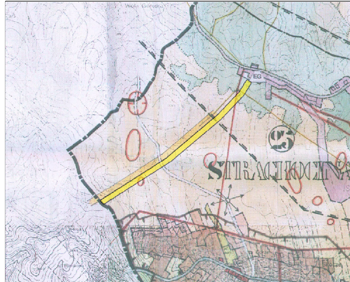
WYRYS ZE STUDIUM